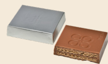
BISCUITINE Milk chocolate filled with chocolate wafer. شوكولاته بالحليب محشوة بوفير الشوكولاته.