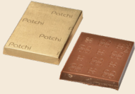
FINESSE Plain milk chocolate. شوكولاته بالحليب سادة.