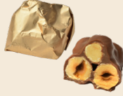
CROQ' NOISETTE LAIT Caramelized hazelnuts enrobed in milk chocolate. بندق بالكرايميل مغطى بالشوكولاته بالحليب.