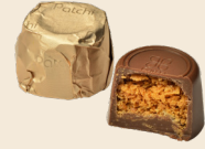
ÉCLAT Milk chocolate filled with crispy crêpes. شوكولاته بالحليب محشوة بالرقائق المقرمشة.