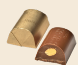
GAITÉ Milk chocolate filled with two whole almonds. شوكولاته بالحليب محشوة بحبتين من اللوز.