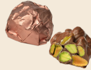
CROQ' PISTACHE LAIT Pistachios & raisins enrobed in milk chocolate. قطع الفستق مغطاة بالشوكولاته بالحليب.