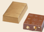
EXCELLENCE Milk chocolate filled with hazelnut pieces. شوكولاته بالحليب محشوة بقطع البندق. متوفرة بالفضي / Available in silver