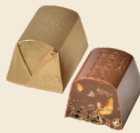
LÉGÈRE Milk chocolate filled with hazelnut pieces & crisped rice. شوكولاته بالحليب محشوة بقطع البندق والأرز المقرمش.