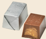
CASABLANCA Milk chocolate filled with gianduja cream, hazelnut pieces & orange flavor. شوكولاته بالحليب محشوة بكريمة الجندوبا، قطع البندق ونكهة البرتقال.