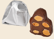
CROQ' AMANDE LAIT Caramelized almonds enrobed in milk chocolate. لوز بالكرايميل مغطى بالشوكولاته الداكنة