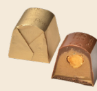
ROYAL Milk chocolate filled with gianduja cream & one whole hazelnut piece. شوكولاته بالحليب محشوة بكريمة الجندوبا وحبّة كاملة من البندق.